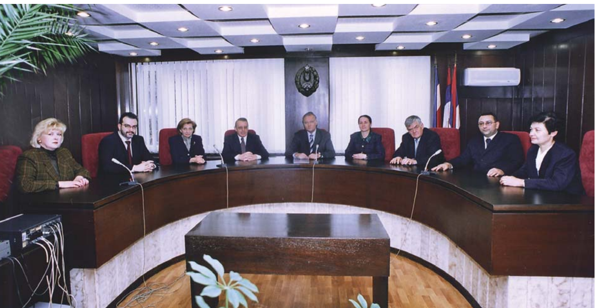
Председник и судије Уставног суда