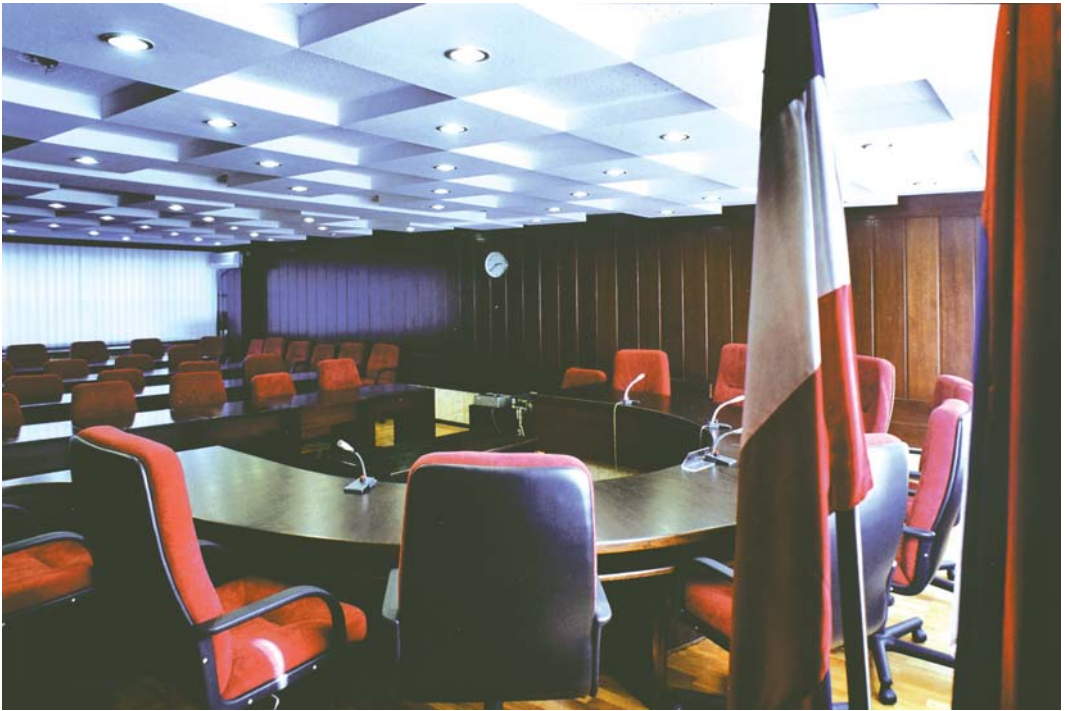
Сала Уставног суда Србије Conference Room of the Constitutional Court