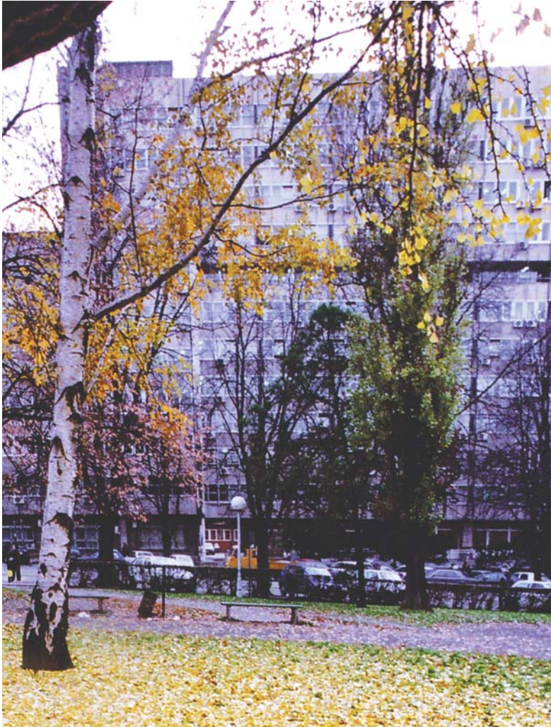
Зграда Уставног суда Србије Building of the Constitutional Court