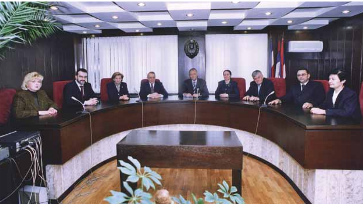
Председник и судије Уставног суда