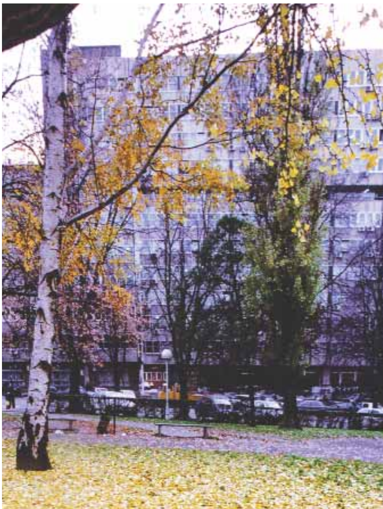
Зграда Уставног суда Србије Београд, Улица Немањина бр. 26