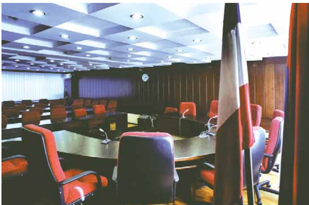
Сала Уставног суда Србије